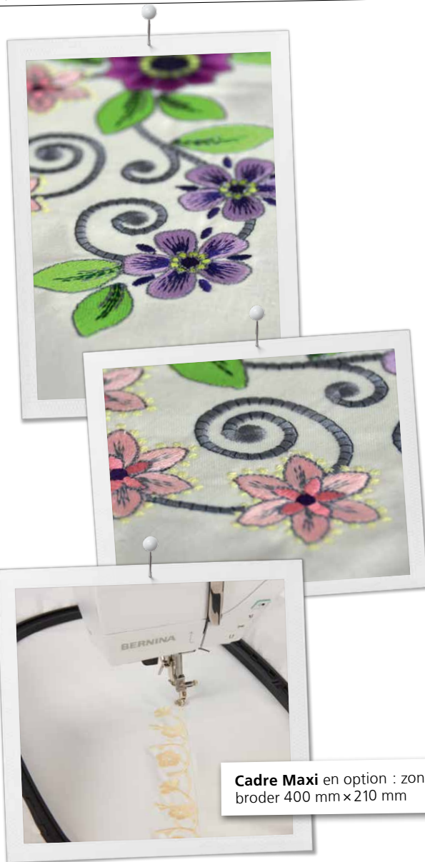
Cadre Maxi en option : zone à broder 400 mm x 210 mm