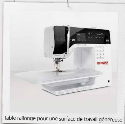
Table rallonge pour une surface de travail généreuse